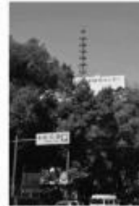
屋上の赤い塔が目印です！