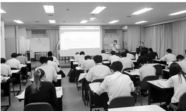
研修室での講義風景(参考)