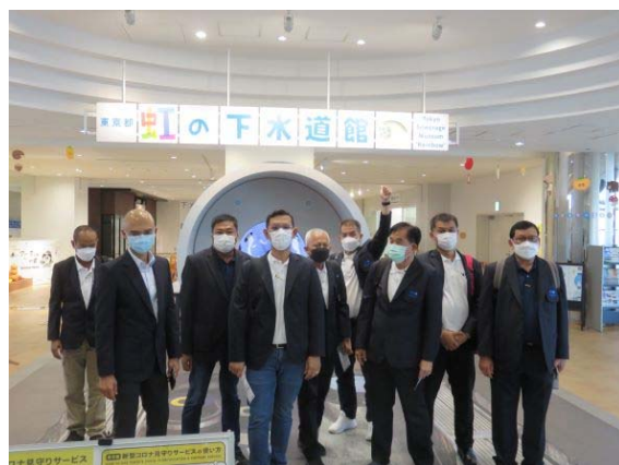
写真3. 虹の下水道館