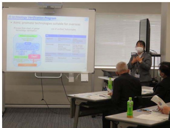
写真2. 講義の様子（その2）