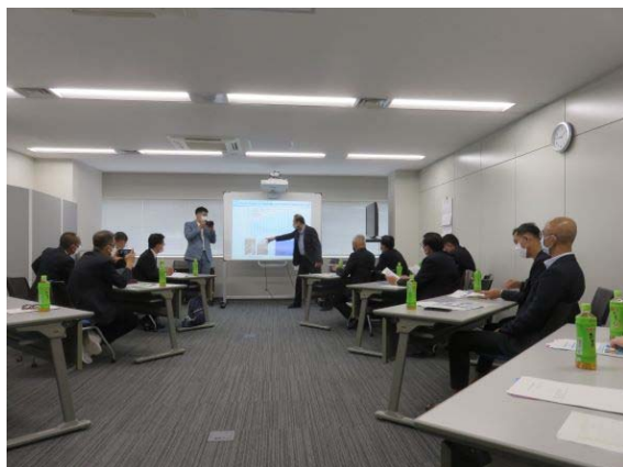
写真1. 講義の様子（その1）