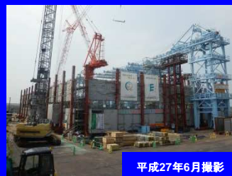
富山市松川雨水貯留施設