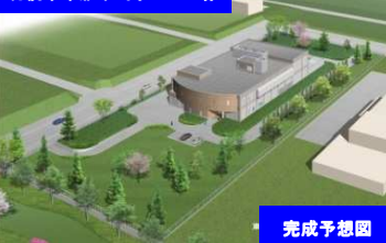
札幌市東雁来雨水ポンプ場