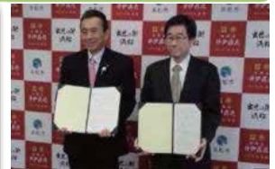
災害支援協定の締結 浜松市長とJS理事長 (平成29年2月3日)