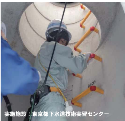
実施施設：東京都下水道技術実習センター