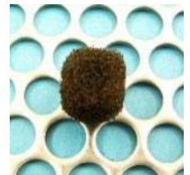
リンポーキューブ (15年経過)と 担体分離装置

寸法：12mm×12mm×15mm 材質：ポリウレタン 特徴：担体分離装置の開口を大きく でき、目詰まりしにくい