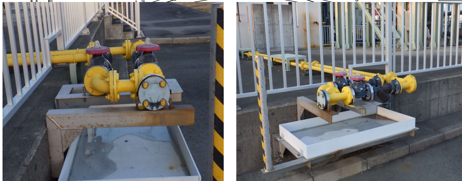
受け入れ口の様子