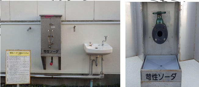
[受け入れ口の様子]