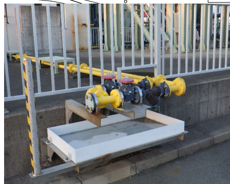
受け入れ口の様子