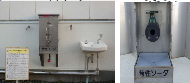
[受け入れ口の様子]