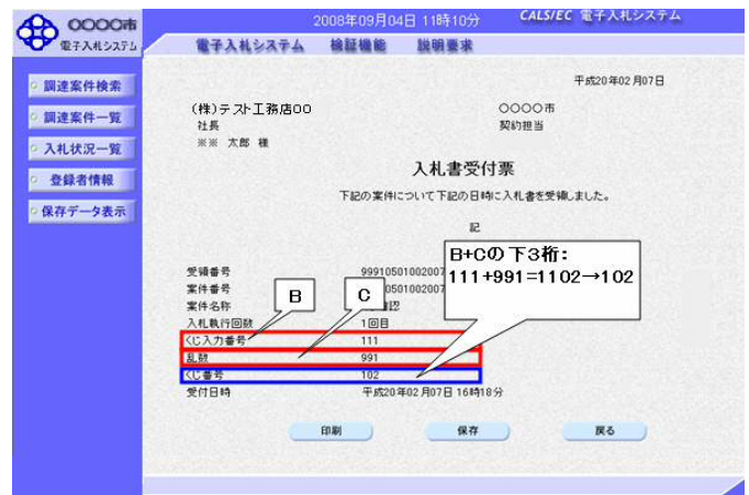
図1. 2. 入札書受付票