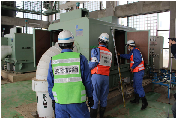
災害発生後一次調査状況