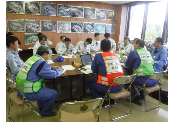
関係機関協議実施状況